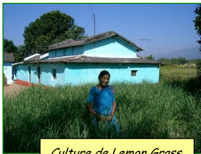
Culture de Lemon Grass

Exploitants : 150 exploitations familiales fin 2008